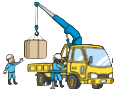
小型移動式クレーン