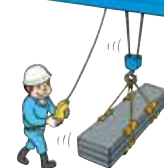
床上操作式クレーン