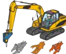
車両系建機(解体用)