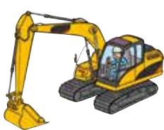
車両系建機(整地等)