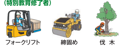
フォークリフト(最大荷重1未満) 締固め(ローラー) 伐木