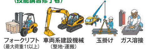
フォークリフト(最大荷重1t以上) 車両系建設機械(整地・運搬) 玉掛け ガス溶接