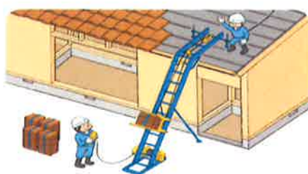
巻上げ機(ウインチ)