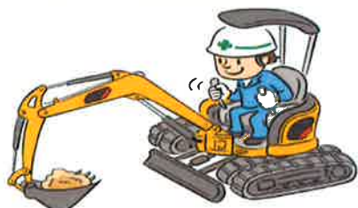
小型車両系建設機械(整地)