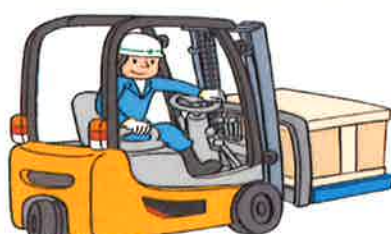
小型フォークリフト